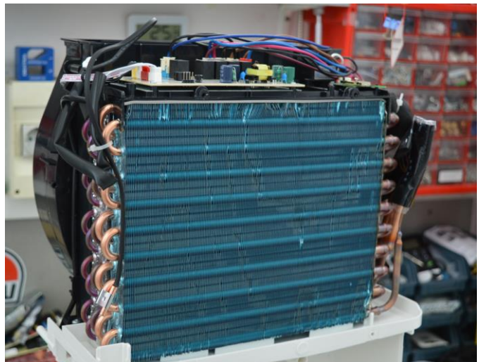
Αφυγραντήρας μετά το service!