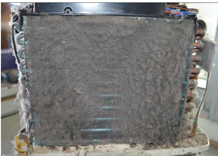
Αφυγραντήρας χωρίς service!

Μπες στο www.juropro.gr βρες το κοντινό σου service και κλείσε ραντεβού.